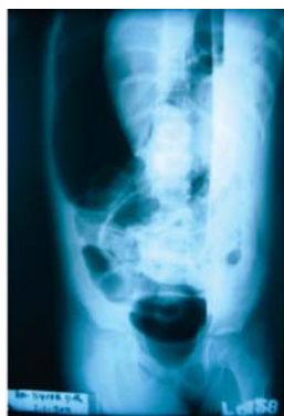
Gambar 3. Foto polos abdomen pada kasus 2